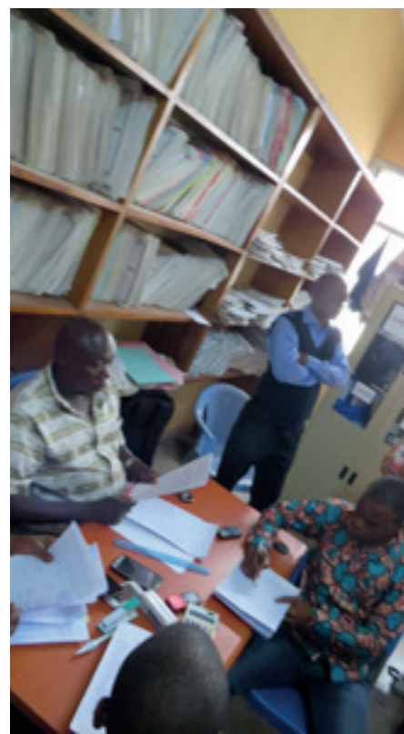
Construction d'un nouvel incinérateur et réhabilitation du service d'archivage.